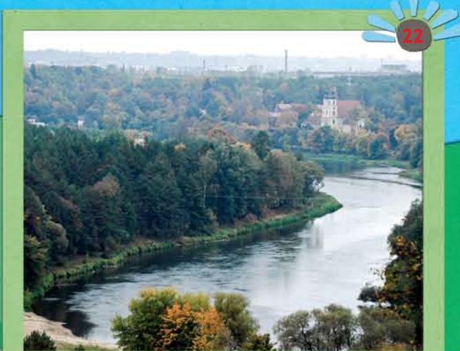
Panorama vom Verkiai Park

Unterwegs können sie in einem der vorhandenen Cafés oder Restaurants einen Imbiss einnehmen oder sich erholen. Und während Sie eine nationale oder internationale Speise verzehren, können Sie sich an den Aussichten auf die Stadt erfreuen.