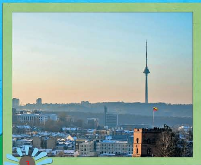
Panorama vom Berg der Drei Kreuze

Wir schlagen vor, die Hauptstadt durch eine Autoexkursion kennen zu lernen, die die schönsten und interessantesten Plätze der Stadt Vilnius und ihrer Umgebung verbindet. Die kreisförmige Exkursionsroute ist etwa 80 km lang. Sie umfasst mehr als 30 besuchenswerte Orte und Aussichtsplätze. Das sind die historisch wichtigsten und schönsten Besuchsobjekte der Stadt Vilnius, die unvergleichlichen Panoramen, die sie umgebenden Hügel und die neue Architektur der Stadt.