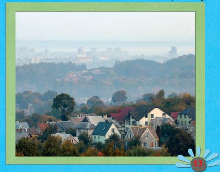
Panorama vom Liepkalnis Berg