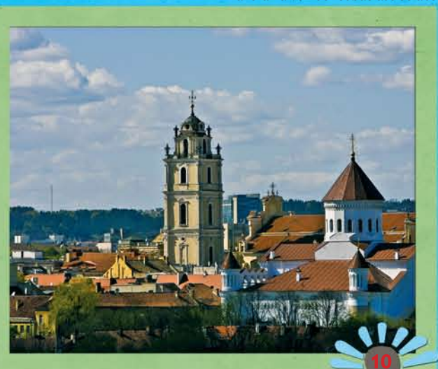
Panorama von der Subačiaus Straße